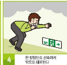
4 한 방향으로 신속하게 밖으로 대피한다