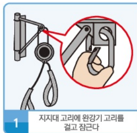
1 지지대 고리에 완강기 고리를 걸고 잠근다