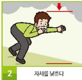
2 자세를 낮춘다