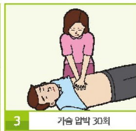
3 가슴 압박 30회