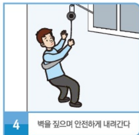
4 벽을 짚으며 안전하게 내려간다