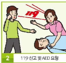
2 119 신고 및 AED 요청