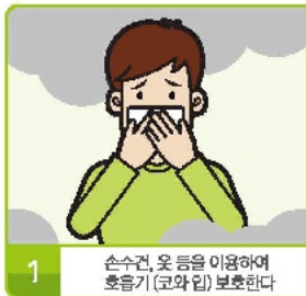
1 손수건, 옷 등을 이용하여 호흡기(코와 입) 보호한다

☞ 대류현상에 따라 뜨거운 연기는 천장으로 올라가고 차가운 공기는 아래로 내려옵니다.