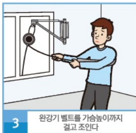
3 완강기 벨트를 가슴 높이까지 걸고 조인다