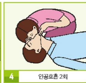
4 인공호흡 2회