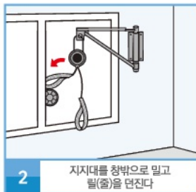
2 지지대를 창 밖으로 밀고 띠(줄)을 단진다