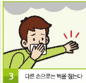
3 다른 손으로는 벽을 짚는다