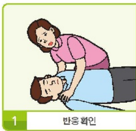
1 반응 확인